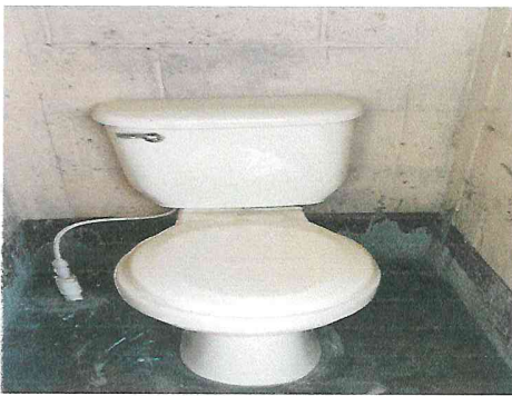
Foto 3: remplazo e intalacion de inodoros con su sistema de drenaje y agua