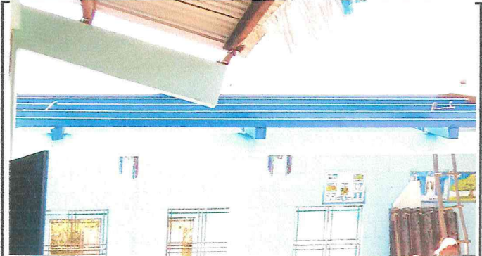
Foto 2: Finalizacion de mantenimiento de estructura metalica techo.