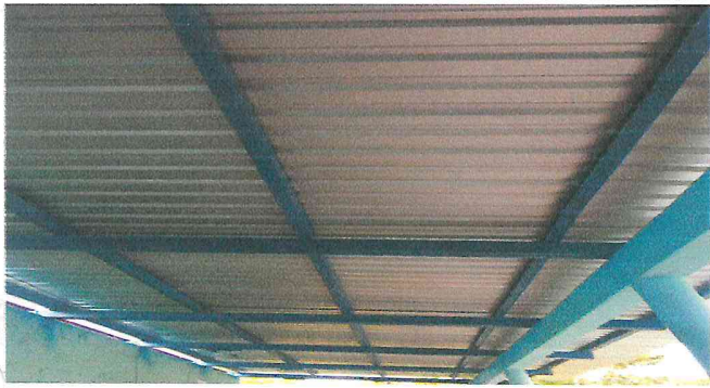
Foto1: Instalacion de lamina troquelada